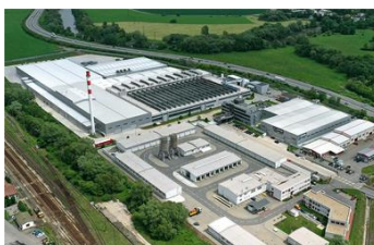
NOVÁ BAŇA | SLOVACCHIA