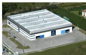
FONDERIA ASTURIAS | SPAGNA

SEDE SCIUKER FRAMES SpA Area P.I.P. - Via Fratze 83020 CONTRADA (AV) ITALY