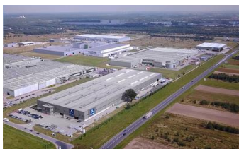
RADOMSKO | POLONIA