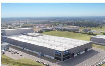
CHEMILLÉ | FRANCIA