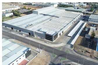
MANZANARES | CIUDAD REAL | SPAGNA