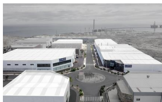
CANARIE | SPAGNA