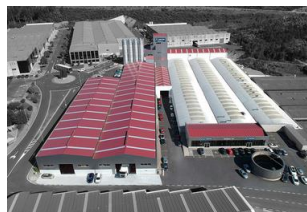
PADRÒN | SPAGNA